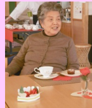
フォンダンショコラ コーヒー

今月のいずみDEカフェは、バレンタイン企画でチョコレートをテーマに、9日～11日にはフォンダンショコラとコーヒー、12日～14日には生チョコと抹茶を召し上がっていただきました。「美味しい」と大好評でした！