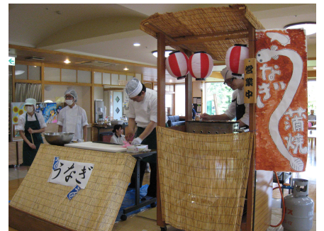
うなぎの蒲焼き実演の様子

七月二十七日(水)外出レクリエーションに行ってきました。場所は大阪狭山市立市民ふれあいの里で、動物との触れ合いや自然の景観を満喫することができました。